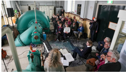
Het toekomstgesprek in de entourage van het oude gemaal.

MONNICKENDAM Het meer dan honderd jaar oude gemaal De Poel lijkt donderdagavond wel een sprookjespaleis. Tijdens een serieus gesprek over de toekomst van het in onbruik geraakte stuk erfgoed in Monnickendam voltrekt zich het ene na het andere betoverende moment. Geheel in stijl kent de avond een goede afloop.