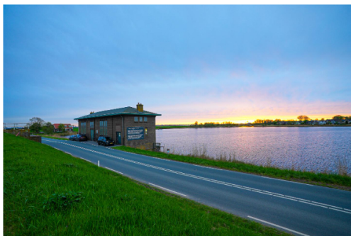
De Poel bij zonsondergang.