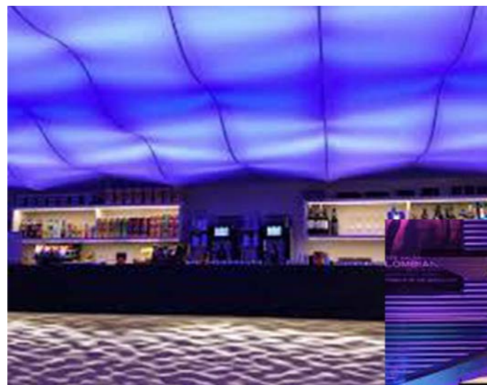
Referentiebeeld voor het concept, vroeg in het proces, filmbeeld rondom