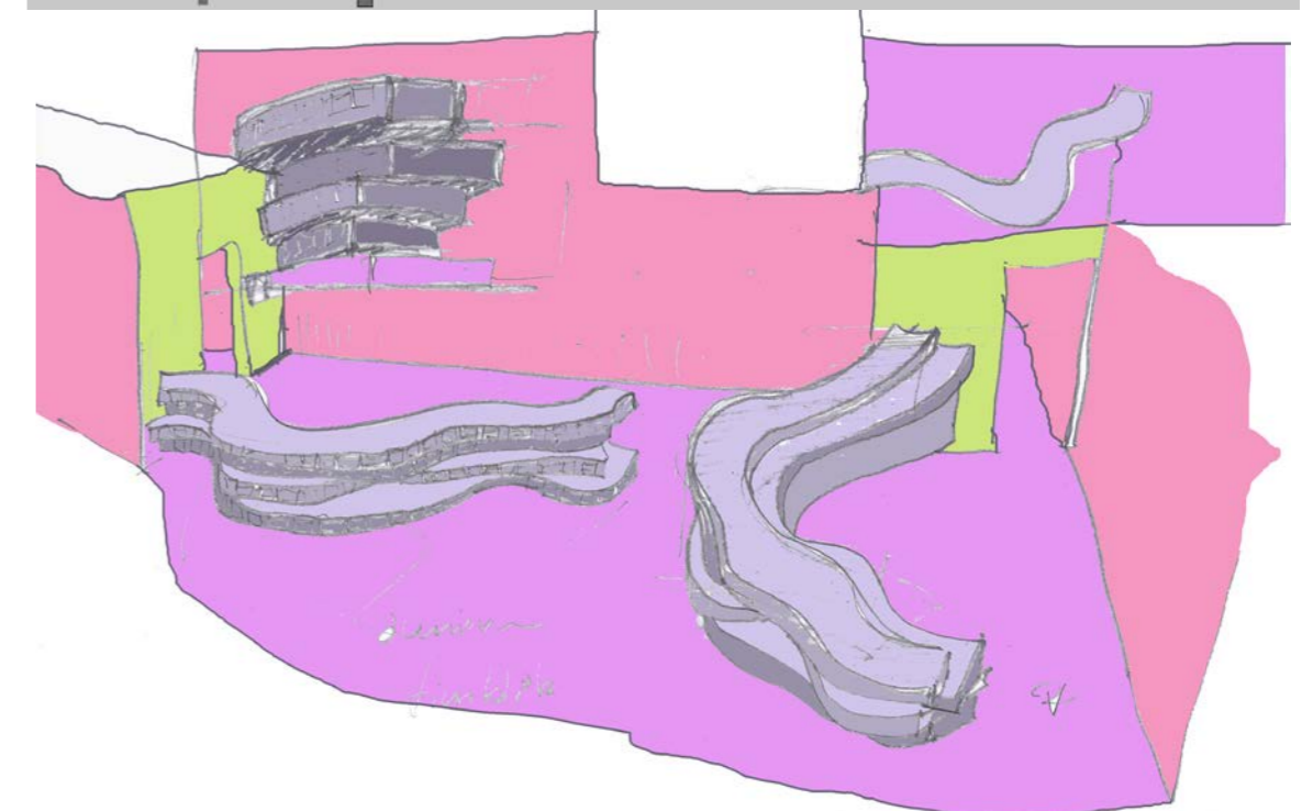
Concept en ontwerpschetsen voor de bar