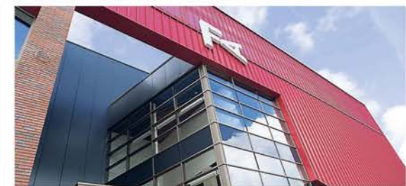
Straatbeeld Filmhuis Alkmaar