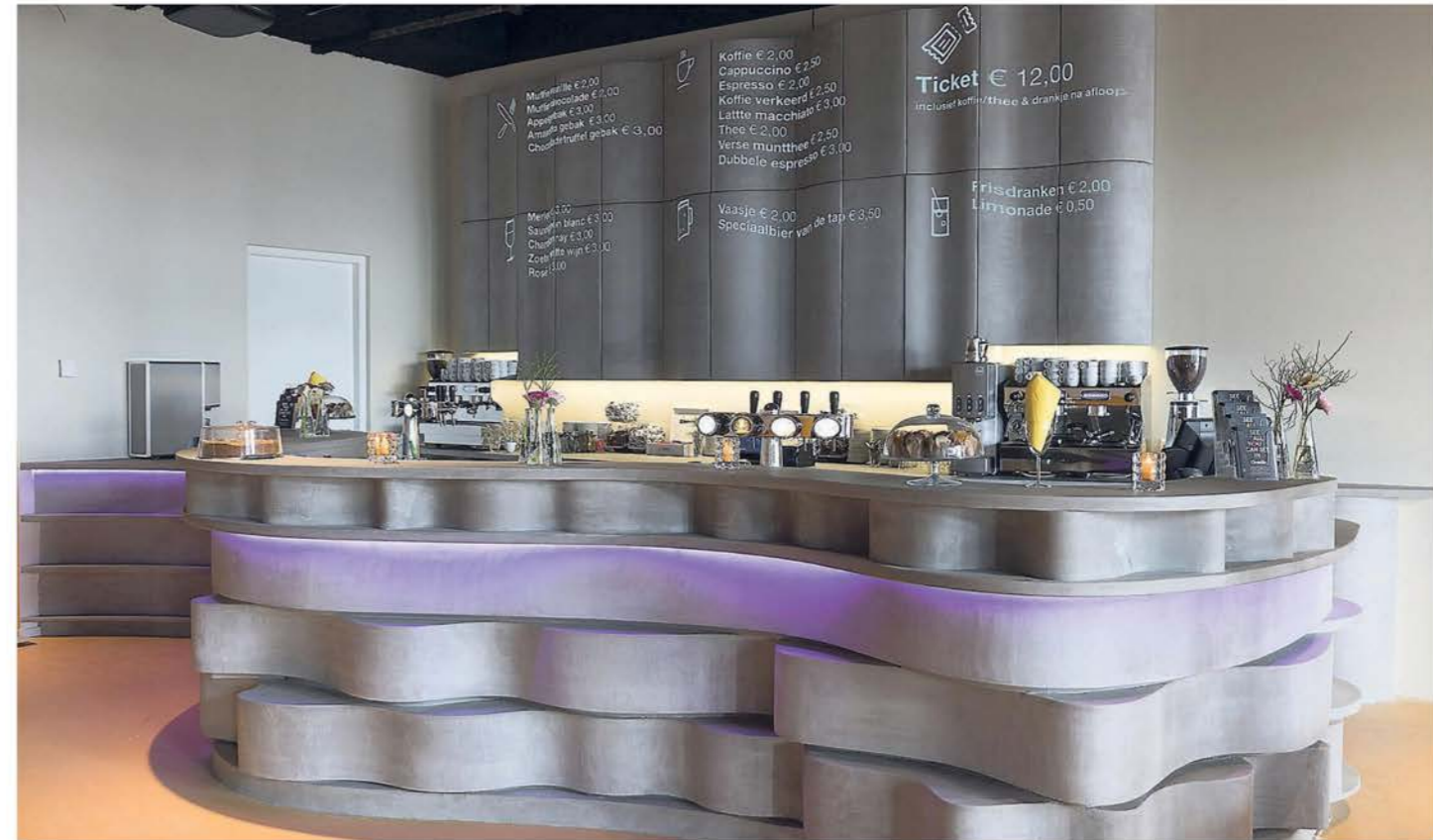
De bar in de foyer van het filmhuis met een capaciteit van acht kopjes koffie per minuut.