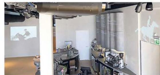
Een van de elf beamers.